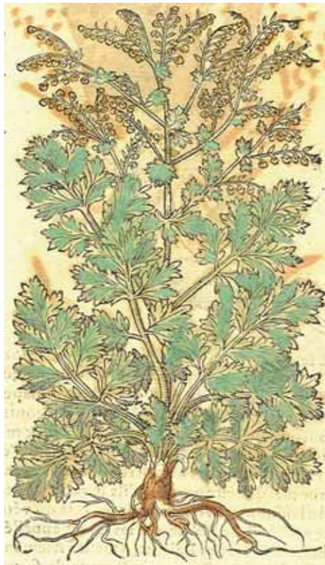
Aluine, ou absinse